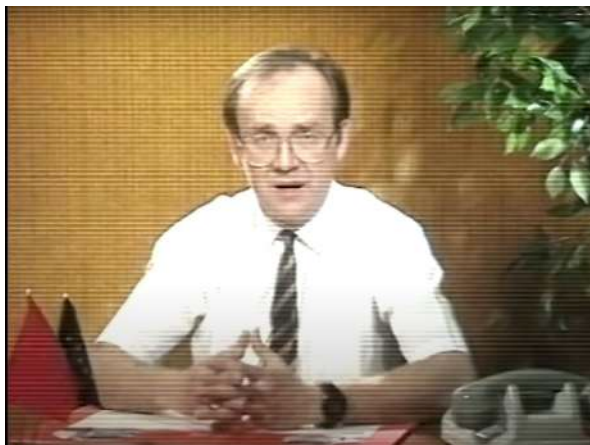
Message à caractère informatif